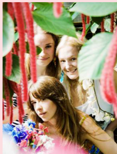
BLAND BLADEN, EN CHAPEL HILL CREW