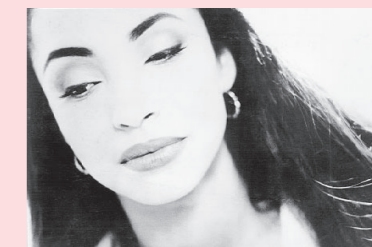
MÅNADENS MJUKA OPERATÖR

Någon som känner sig manad att ta över stafettpippen och föreslå vänt-låt till februari?