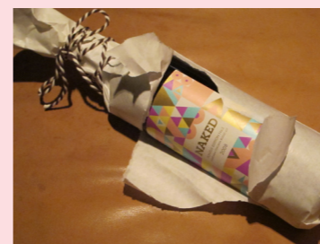
JAI! PRECIS VAD JAG ÖNSKADE MIG!

Rubrikens uppmaning är inte så ekvok som du tror. "Naked" är namnet på del tre i Pontus vinbibliotek och det är den nakna sanningen att detta är vårt mest högkvalitativa vin, hittills. En Super Tuscan med en unik druvblend av Carignan och Sangiovese. Ett samarbete med den berömde vinmakaren Paolo Caciorgna och producenten Barone Pizzini. Exklusivt som sjutton, då endast 500 flaskor släppts och av dem ynka 100 till Systembolagets beställningssortiment. En julklapp med guldkant till någon du gillar - eller till dig själv!