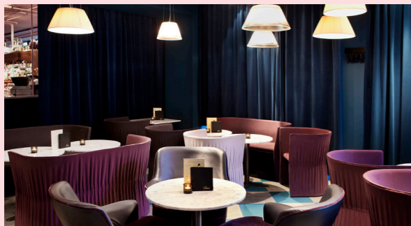
En klädesdräkt som tränar efter komplimanger.

Jag är jättenöjd med att vi har fått en entré mot Norrlandsgatan, till att börja med. Snäppet efter är själva formen på baren - en rund och välkomnande form. Det ger bra spannläge, eftersom man kan tjuvkika rätt över. Det här är en bar som inte ser ut som någon annan i Sverige och det är jag nöjd med.